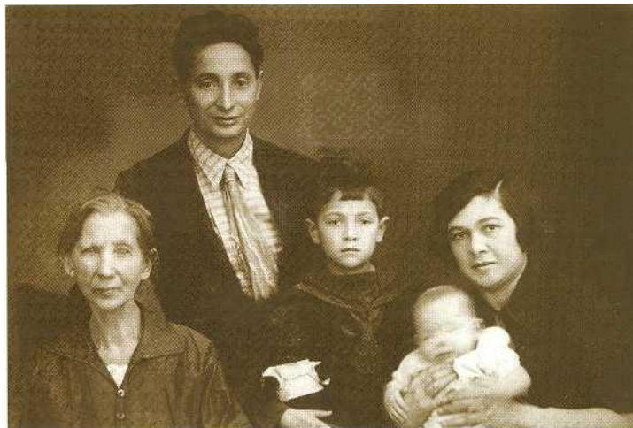
Ярославские . 1935 год

1927 и 1928 годы Р.А. проработала врачом-стаже-