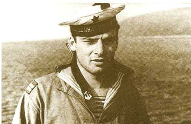
Курсантская практика. Рейд о. Кильдин. Северный флот

шой череп) пользовался уважением и доверием на всех последующих занятиях и экзаменах. С первого по третий курс я был старшиной своего класса, а на четвертом и пятом курсах — старшиной роты на своем курсе. Так что опыт работы с подчиненными еще в училище накопил достаточный, а командовать сокурсниками и при этом сохранить уважение и оставаться, что называется, человеком — всегда непросто. Но, как выяснилось при наших традиционных встречах, мне это удавалось. И, конечно, я был в комсомольском активе. (Это у меня, наверное, от мамы. Она до самой смерти вела активную общественную работу). В 1960 году я стал членом партии. В заявлении совершенно искренне писал «...жизни вне партии для себя не мыслю». Нужно сказать, что так считал и до последних лет, когда мы все прозрели. Но и тогда, написав заявление о выходе из партии, я оставил себе партбилет в память о тех друзьях-коммунистах, которые, как нас и учили, всегда были впереди и в самых трудных условиях, рискуя жизнью, выполняли свой долг, оставаясь примером для других. Хотя, чем выше поднимался по служебной лестнице, тем все больше понимал несоответствие слов и действий наших идейных вдохновителей. Забегая вперед, скажу,