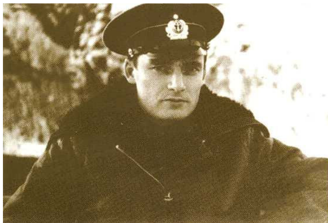
На боевом дежурстве. Губа Нерпичья, Северный флот. 1968 год

Первые выходы в море. Первое автономное плавание. Я служил с удовольствием. Все было интересно, а полученные знания и накапливающийся опыт позволил довольно быстро заслужить уважение и авторитет грамотного специалиста. В 1966 году я уже был назначен командиром дивизиона движения. В 1967 году сдал на допуск к самостоятельному управлению подводной лодкой и получил нагрудный знак «Командир подводной лодки», которым удостоивались командиры, старшие помощники командиров и механики, сдавшие все положенные зачеты на допуск к самостоятельному управлению ПЛ в любых, простых и сложных, условиях плавания. Уже в 1968 году я был назначен командиром электромеханической боевой части (БЧ-5) крейсерской АПЛ. Я был первым из нашего выпуска, кого назначили на эту должность. Эта должность