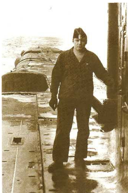
На борту АПЛ, Баренцево море. Командир БЧ-5. 1978 год

дующих поколениях АПЛ. Нам удавалось выходить с минимальными потерями порой из таких аварийных ситуаций, из которых других, бывало, приводили без хода, на буксире или, того хуже, в аналогичной ситуации погибла наша лодка в Бискайском заливе. После одного из автономных походов за грамотные и самоотверженные действия в аварийной ситуации, я был награжден тогда недавно введенным орденом «За службу Родине в Вооруженных силах СССР» 3-й степени. Награжден был и командир. А политотдел расщедрился и поощрил меня талоном на ковер 3 x 2 м, и а что зам. по политчасти, считая себя обойденным, обиделся. Побежал в политотдел и попросил заменить этот ковер на два ковра 2 x 1,5м, один из которых, конечно, взял себе. Рассказываю это не из чувства мелочности, а чтобы показать, до какой низости порой опускались эти служители культа. И это один из самых слабых примеров.