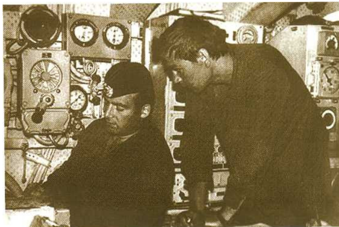
На пульте управления энергетической установкой АПЛ. 1970 год

сравнима с должностью главного инженера крупной атомной электростанции в условиях гражданской, но с учетом того, что эта атомная установка сжата до объемов прочного корпуса, движется и качается по воле стихии и планов командования. Это очень ответственная должность. По сути, все жизнеобеспечение, движение и плавучесть подводной лодки, основная роль в подготовке экипажа по борьбе за живучесть ложится на плечи командира БЧ-5. Я был готов, по мнению командования, к этой роли и дальнейшей службой подтвердил это. Наш экипаж был всегда примером для других. Тренировками и учениями, хорошо и добросовестно налаженной специальной подготовкой удалось создать костяк офицеров и мичманов, вокруг которого быстро осваивались и входили в строй молодые, вновь приходящие матросы, офицеры и мичманы. Благодаря этой подготовке нам удавалось выходить победителями в самых сложных условиях, которых за 12 лет моего пребывания в должности было, к сожалению, предостаточно. Ведь это была АПЛ первого поколения с недоработками и недостатками, которые потом, благодаря и нашему, в том числе, печальному опыту, были учтены и ликвидированы на после-